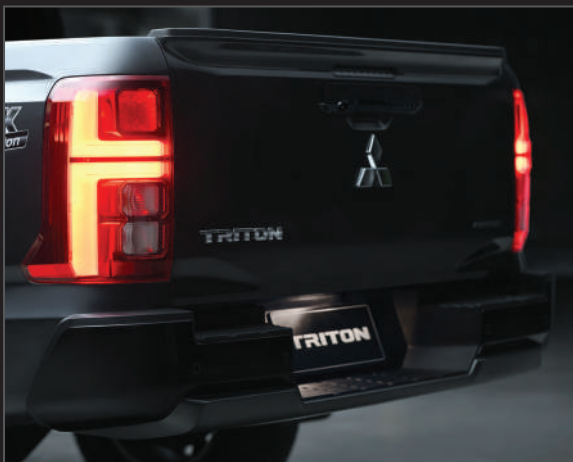
กันชนหลังสีดำ ตกแต่งสีไทเทเนียมรมดำ Black Rear Bumper with Smoked Titanium Accent