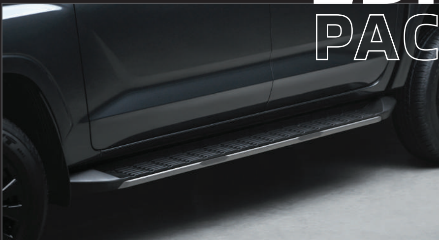
บันไดข้างสีดำ ตกแต่งสีไทเทเนียมรมดำ Smoked Titanium Accent Side Step

กับ ออล-นิว มิทซูบิชิ ไทรทัน แบล็ก เอ디션 ทรงพลังแฝงความมีสไตล์แบบที่คุณตามหา