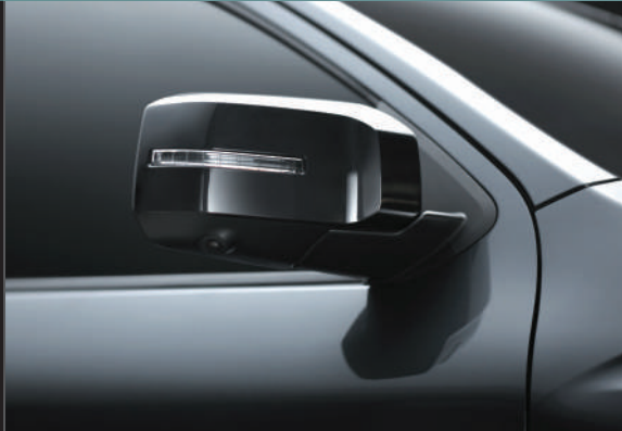
โดนามิก ชิลด์ สีดำเงา Black Dynamic Shield