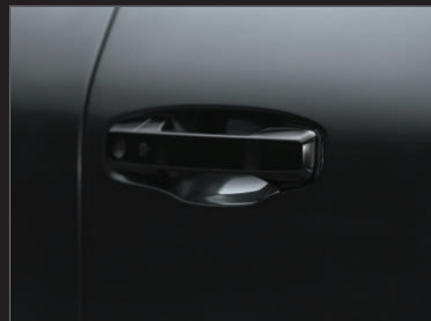
มือเปิดประตูสีดำเงา Black Door Handle