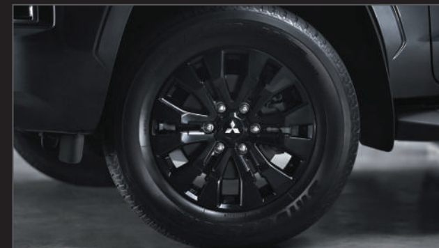
ล้ออัลลอยสีดำ 18" 18" Black Alloy Wheels